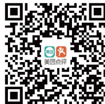
【扫码预约电话指导】